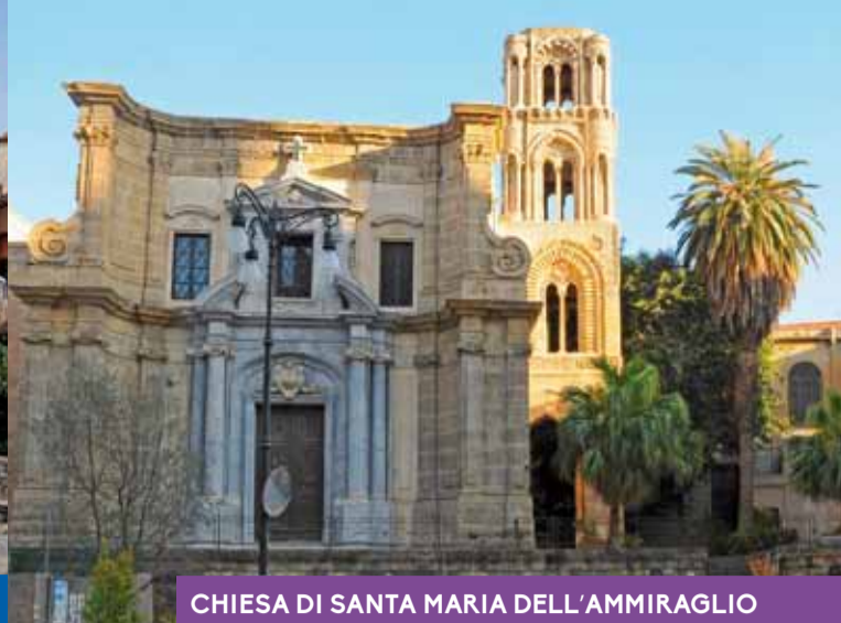
CHIESA DI SANTA MARIA DELL'AMMIRAGLIO