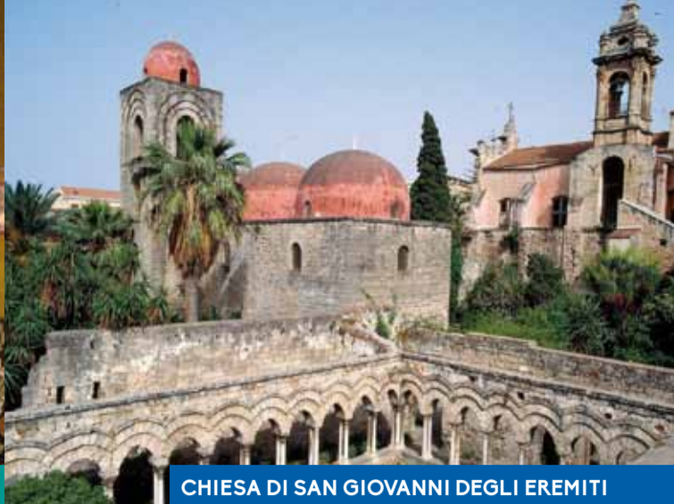
CHIESA DI SAN GIOVANNI DEGLI EREMITI