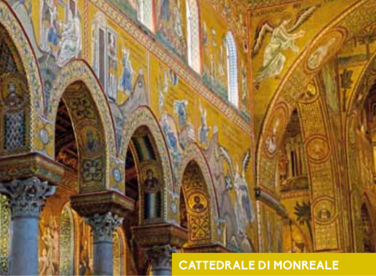
CATTEDRALE DI MONREALE

Il palazzo della Zisa (1190 ca.) (dall'arabo al-Aziz , "il glorioso", "lo splendido"), fondato dal re Guglielmo I, costituisce un sorprendente esempio di architettura palaziale ifigena . Sorgeva fuori le mura dell'antica città di Palermo, costituendo il monumento più importante e rappresentativo del Genoard (dall'arabo Jannat al-ar , "giardino" o "paradiso della terra") che s'ispirava ai giardini di ascendenza islamica come i riyad di origine persiana. L'altezza totale si sviluppa su tre livelli, marcati all'esterno da sottili cornici e da archi ciechi a rincasso. Al centro del piano terreno, in asse con il portale principale, si trova l'ambiente di rappresentanza o «sala della fontana», sala a iwān di tipo islamico che costituisce, di fatto, il cuore nevralgico di tutto il palazzo, aperta sul vestibolo attraverso un ampio arco ogivale sorretto da colonne binate ai lati delle quali sono i resti dell'epigrafe in stucco con il nome del palazzo e il riferimento a Guglielmo II. Tutta la sala è decorata con mosaici decorativi e tarsie marmoree in opus sectile , ampie nicchie voltate a muqarnas e un raro pannello di mosaico bizantino con temi profani e iconografie islamiche.