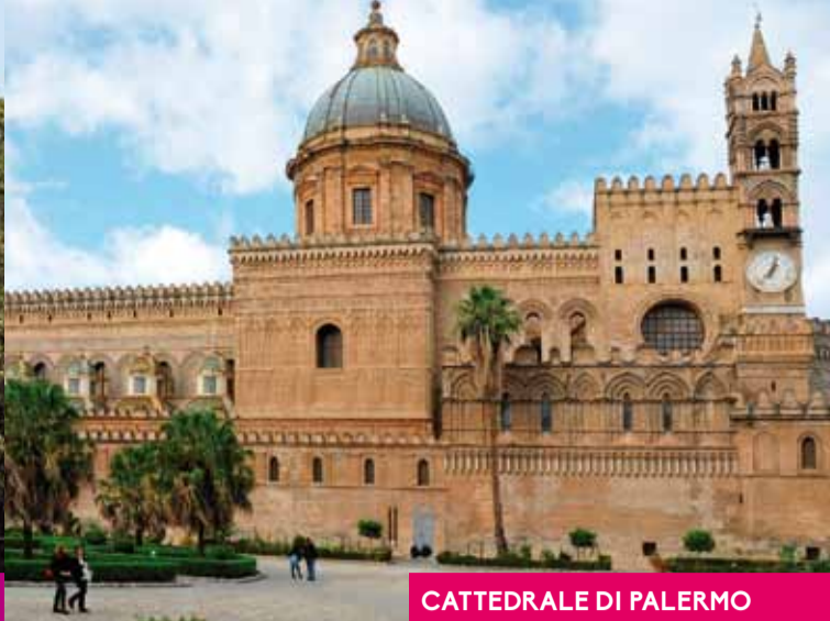
CATTEDRALE DI PALERMO