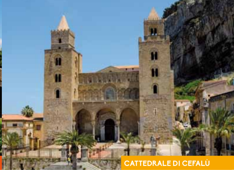
CATTEDRALE DI CEFALÙ