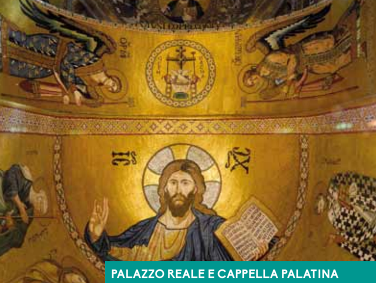
PALAZZO REALE E CAPPELLA PALATINA