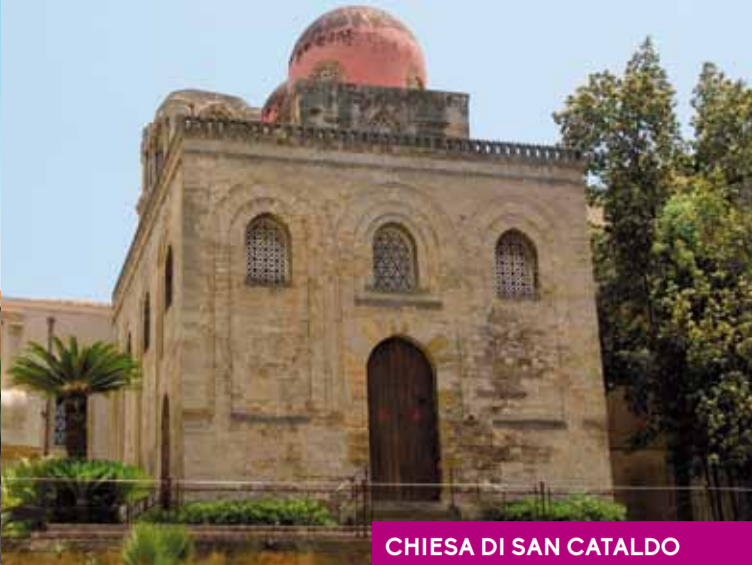
CHIESA DI SAN CATALDO