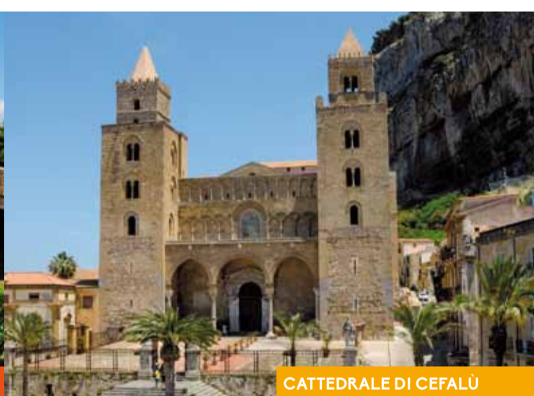
CATTEDRALE DI CEFALÙ