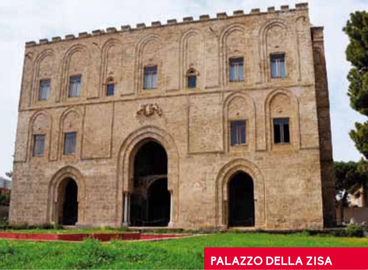
PALAZZO DELLA ZISA