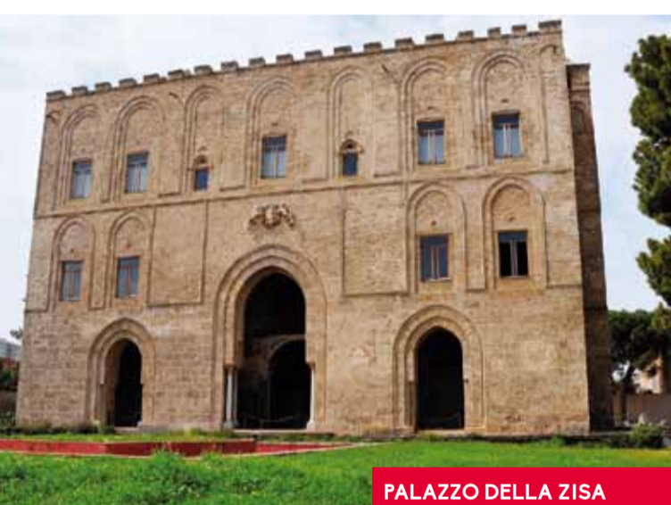
PALAZZO DELLA ZISA