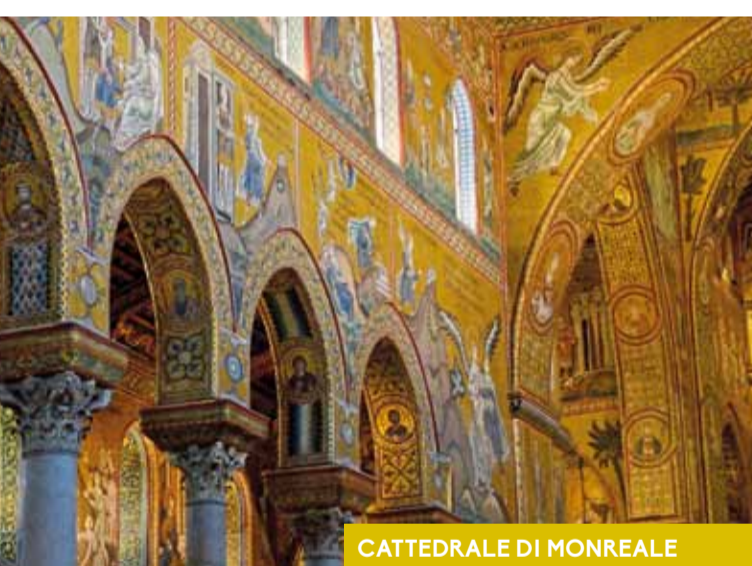
CATTEDRALE DI MONREALE

Il palazzo della Zisa (1190 ca.) (dall'arabo al-Aziz , "il glorioso", "lo splendido"), fondato dal re Guglielmo I, costituisce un sorprendente esempio di architettura palaziale ifigena . Sorgeva fuori le mura dell'antica città di Palermo, costituendo il monumento più importante e rappresentativo del Genoard (dall'arabo Jannat al-ar , "giardino" o "paradiso della terra") che s'ispirava ai giardini di ascendenza islamica come i riyad di origine persiana. L'altezza totale si sviluppa su tre livelli, marcati all'esterno da sottili cornici e da archi ciechi a rincasso. Al centro del piano terreno, in asse con il portale principale, si trova l'ambiente di rappresentanza o «sala della fontana», sala a ivan di tipo islamico che costituisce, di fatto, il cuore nevralgico di tutto il palazzo, aperta sul vestibolo attraverso un ampio arco ogivale sorretto da colonne binate ai lati delle quali sono i resti dell'epigrafe in stucco con il nome del palazzo e il riferimento a Guglielmo II. Tutta la sala è decorata con mosaici decorativi e tarsie marmoree in opus sectile , ampie nicchie voltate a muqarnas e un raro pannello di mosaico bizantino con temi profani e iconografie islamiche.